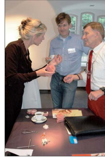
In der parallelen Ausstellung einzelner Firmen der Dentalindustrie konnte sich über neueste Produkte und Materialien informiert werden.

IOS Hannover Kirchröder Str. 77 30625 Hannover Tel.: 05 11/55 44 77 Fax: 05 11/55 01 55 E-Mail: ios@raiman.de www.ios-hannover.de