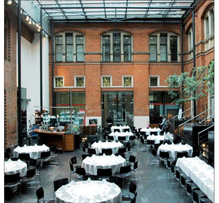
Veranstaltungsort war das Alte Rathaus von Hannover.