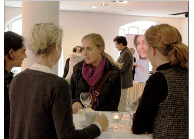
In den Pausen konnten Erfahrungen unter Kollegen ausgetauscht werden.